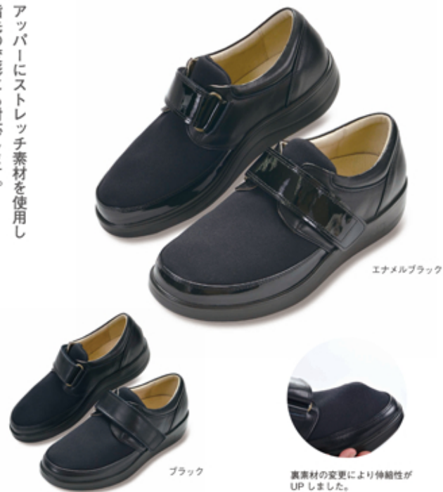
エナメルブラック

アッパーにストレッチ素材を使用し 指先の変形にも対応します。 踵のカウンターと甲のベルトで しっかりと足を支える、高機能なアイテムです。