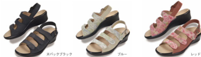
ヌバックブラック