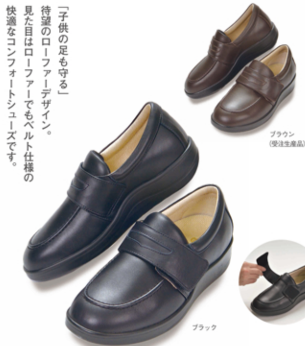
ブラウン (受注生産品)