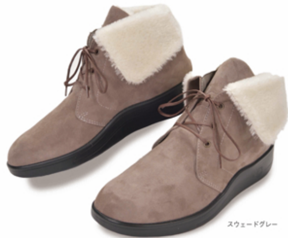
スウェードグレー

サイズ：21.5～25.5cm (0.5cm 刻み) カラー：スウェードグレー、スウェードブラック インソール：EVAキャンブレル仕様