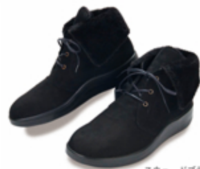
スウェードブラック